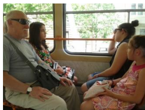
A 6-os villamoson

A mi Lányaink azt mondták, hogy nekik nagyon tetszett és mindent értettek. lehetséges, de másképpen, mint ahogyan a felnőttek érthetik a saját sorsukon, érzelmeiken átengedve ezt a filmet. (Gondolom!)