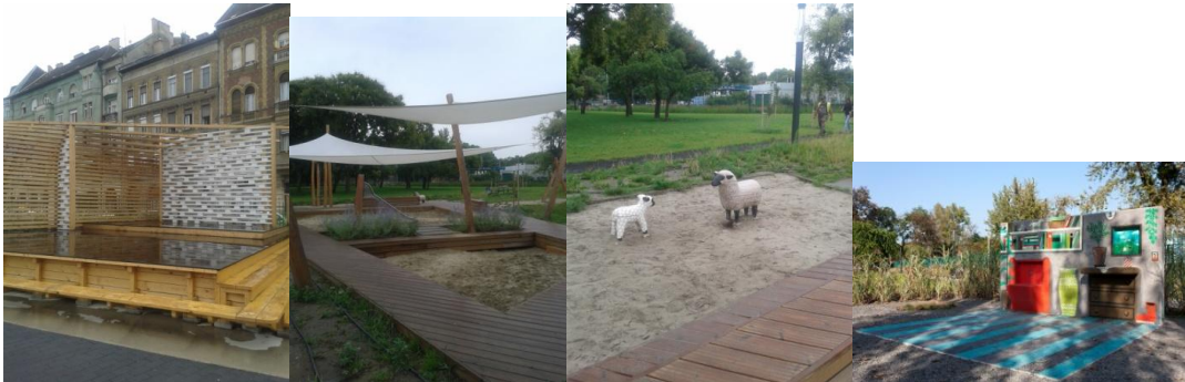
Gróf Teleki László